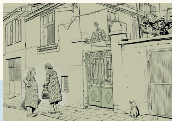
Imatge: Gelev, Penko (2012). Villages collection. Trobat a Doodlers Anonymous

I tu de qui eres? Aiolo de Malferit i l'ús de la llengua com a símbol cultural.